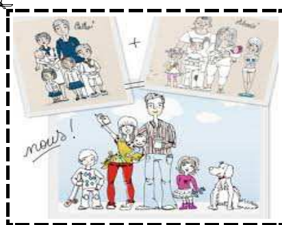
Camp des familles mois d'août 2014

-Merci Audrey pour toutes ces infos et déjà, bonne réussite pour ton camp ...2014 ! MD