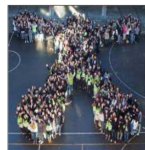
Un module vivant dans la cour du Collège

la grande salle du 104, (sic!) et puis dans les couloirs du nouveau bâtiment, après sa construction, en 1984. Le fait que plusieurs professeurs soient issus (suite en page 3)