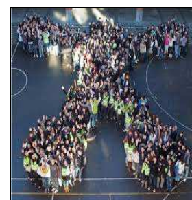
Un module vivant dans la cour du Collège

la grande salle du 104, (sic!) et puis dans les couloirs du nouveau bâtiment, après sa construction, en 1984. Le fait que plusieurs professeurs soient issus (suite en page 3)